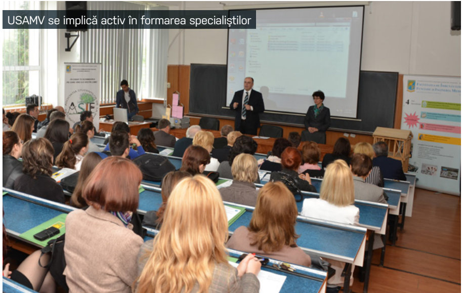
USAMV se implică activ în formarea specialiștilor

Activitățile de furnizare a abilităților/competențelor și de asigurare a oportunităților au fost corelate cu